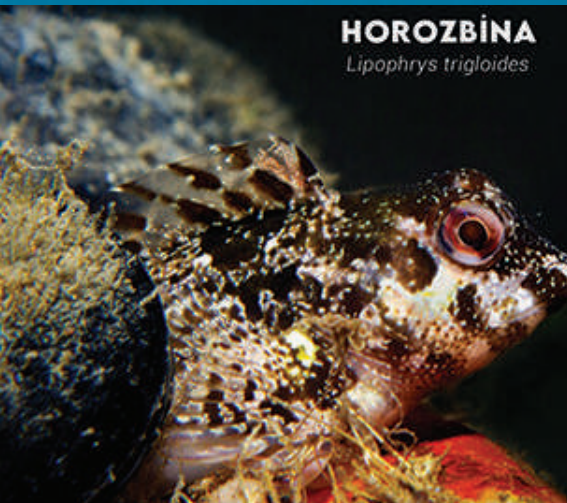
HOROZBİNA Lipophrys trigloides