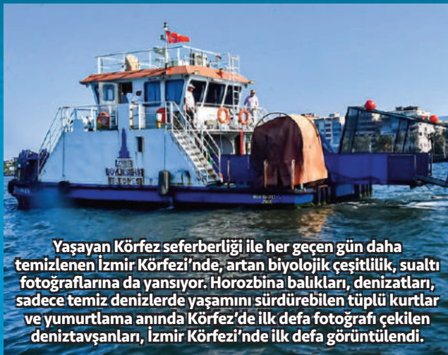
Yaşayan Körfez seferberliği ile her geçen gün daha temizlenen İzmir Körfezi'nde, artan biyolojik çeşitlilik, sualtı fotoğraflarına da yansıyor. Horozbina balıkları, denizatları, sadece temiz denizlerde yaşamını sürdürebilen tüplü kurtlar ve yumurtlama anında Körfez'de ilk defa fotoğrafı çekilen deniztavanları, İzmir Körfezi'nde ilk defa görüntülendi.