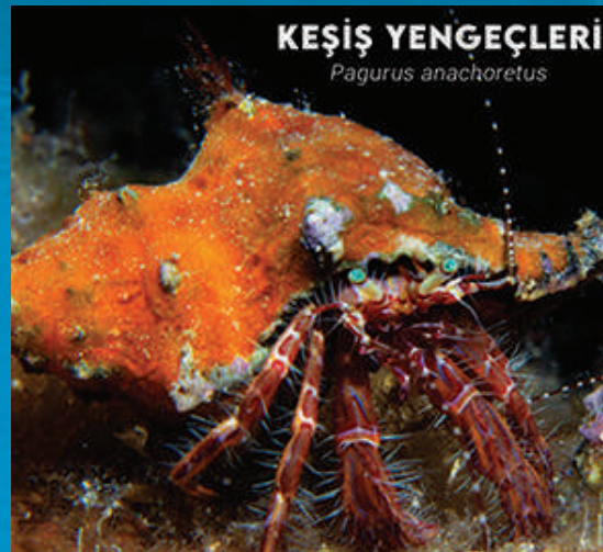
KEŞİŞ YENGEÇLERİ Pagurus anachoretus