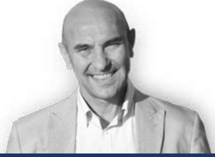
TUNÇ SOYER İzmir Belediye Başkanı