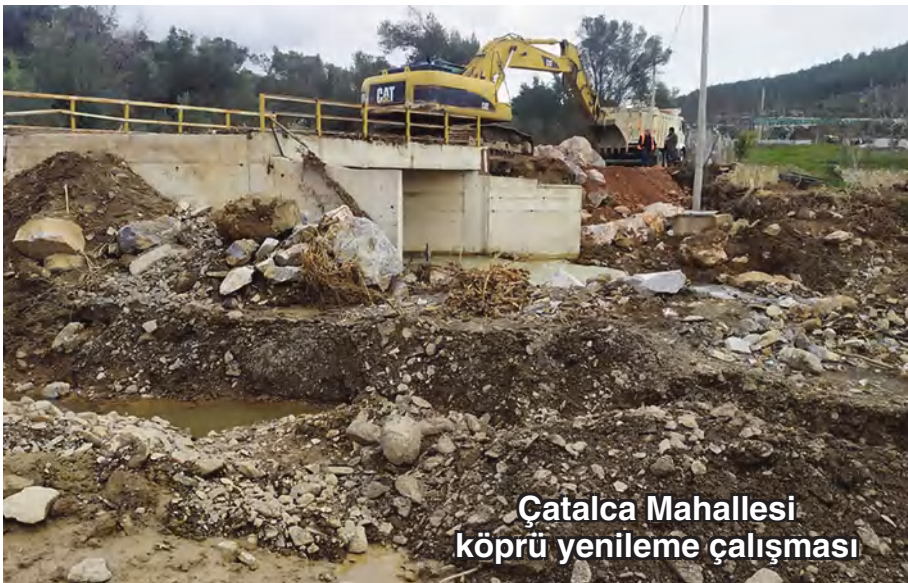
Çatalca Mahallesi köprü yenileme çalışması

İlçede ihtiyaç sahibi 3 bin 45 haneye 3 bin 628 gıda paketi, dört haneye ev eşyası, 155 kişiye yangın ve sel afetleri nedeniyle ortaya çıkan zararları nedeniyle yaklaşık 800 bin TL nakdi yardım, acil ihtiyacı olan yurttaşlara bin 750 TL nakdi yardım, Ramazan ve Kurban bayramlarında 673 kişiye 269 bin 200 TL nakdi yardım, 2 bin 238 çocuğa 214 bin 848 litre süt desteği, 811 çocuk için bot ve mont, 55 tablet, 397 eğitim kartı, engelli ve hasta yurttaşlar için de gerekli malzemeler verildi.