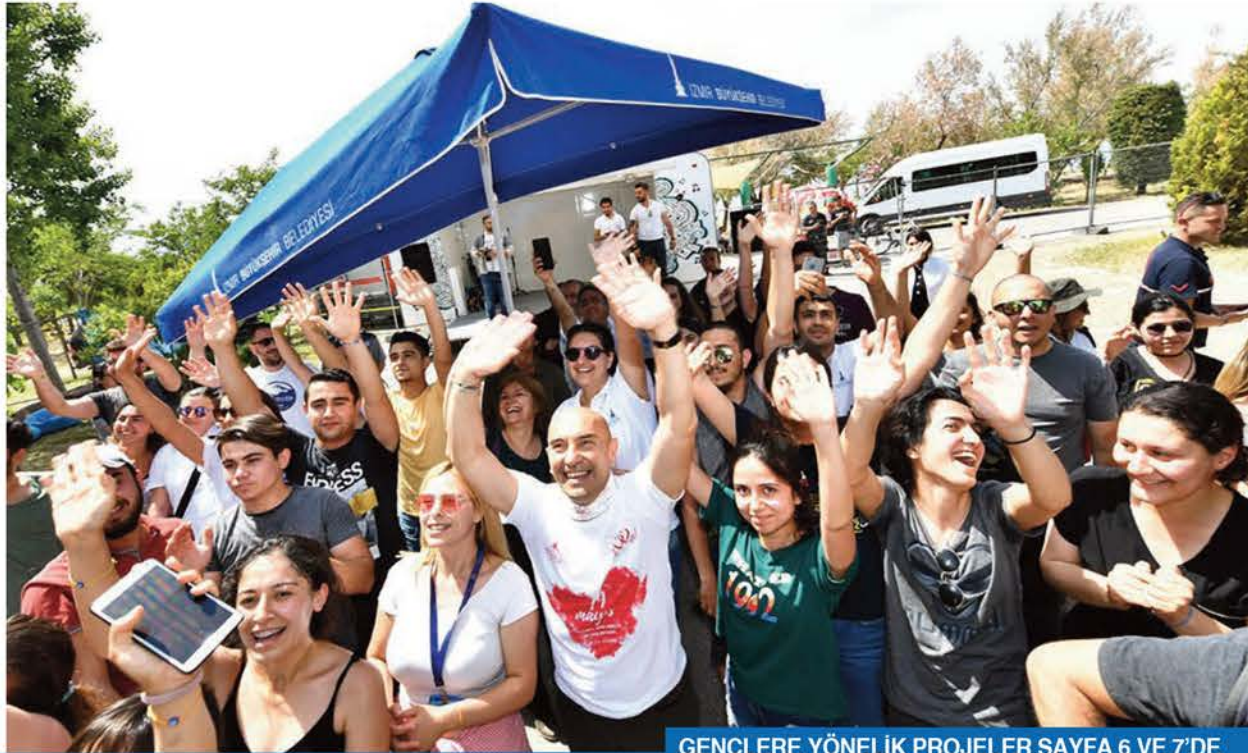
GENÇLERE YÖNELİK PROJELER SAYFA 6 VE 7'DE

"GENÇLERE yönelik projelerimiz üç ana temele oturuyor. Ceplerine fayda sağlayacağız, ruhlarına hitap edeceğiz ve yaşamlarına dokunacağız. Bu projeleri bizden çok gençler belirliyor. Birlikte çalışıyoruz ve yönetim süreçlerine gençleri çok daha fazla dahil edeceğiz. Dünyanın gelişim ve değişim hızına gençlerle ayak uyduracağız; yıllara onların enerjisiyle koşacağız."