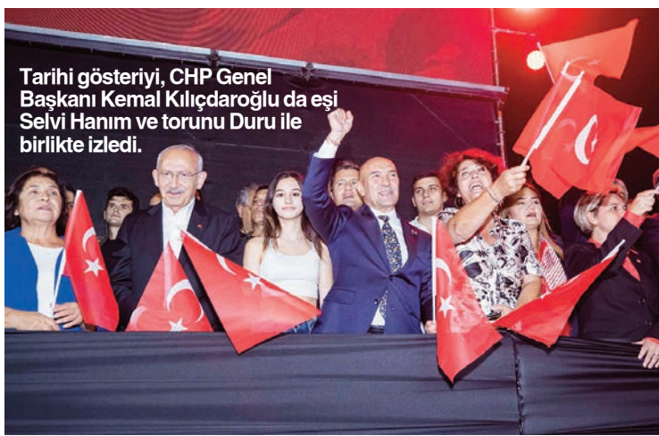
Tarihi gösteriyi, CHP Genel Başkanı Kemal Kılıçdaroğlu da eşi Selvi Hanım ve torunu Duru ile birlikte izledi.

"9 Eylül, dünya halklarının iligini kemigini sömürnen emperyalizme vurulmuş tarihin en büyük tokadıdır" diyen Başkan Soyer, şöyle devam etti: