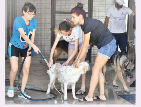
Hayvanların, sıcak ilgiyle mutlu oldukları her hallerinden belli olurken; etkinlikte birbirinden renkli görüntüler ortaya çıktı.

ve idarenin yapıldığı Kocatepe'ye 05.30'da ulaşı ve Atatürk Anıtı'na çelenk bırakıldı. Kılıçdaroğlu, "Atalarımız, bağımsız ve demokratik bir Türkiye'de yaşamak için canlarını verdi. Bize düşen görev; daha güzel bir gelecek için çalışmaktır. O mücadelenin başlangıcı da burası olsun diyoruz" dedi. Başkan Soyer ise Atatürk'ün izinden gururla yürüdüklerini belirterek, "100 yıl önce atalarımız bu cennet vatanı bize emanet etmek için olağanüstü bir zafer kazandı ve Cumhuriyet kuruldu. 100 yıl öncenin heyecanı yeniden yaşadık. 9 Eylül'de herkesi büyük kutlama törenlerine bekliyoruz" diye konuştu.