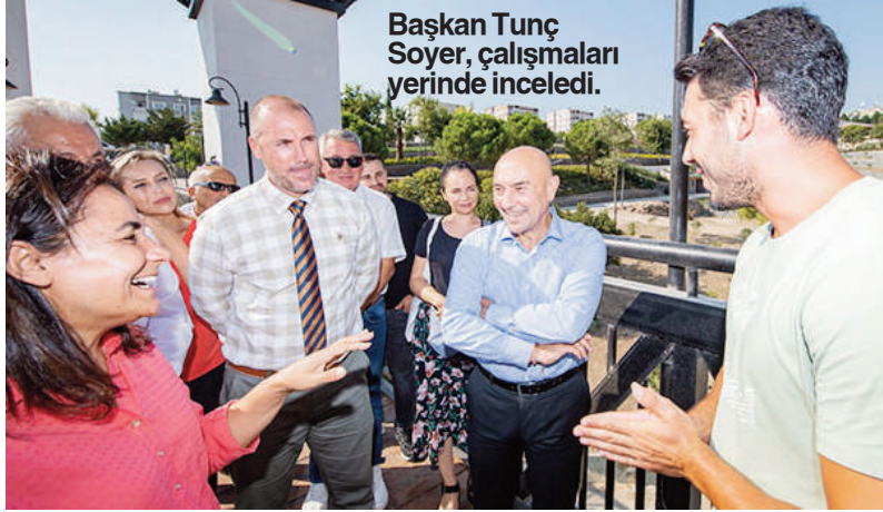
Başkan Tunç Soyer, çalışmaları yerinde inceledi.