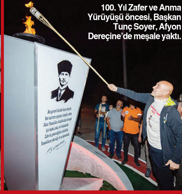
100. Yıl Zafer ve Anma Yürüyüşü öncesi, Başkan Tunç Soyer, Afyon Dereçine'de meşale yaktı.