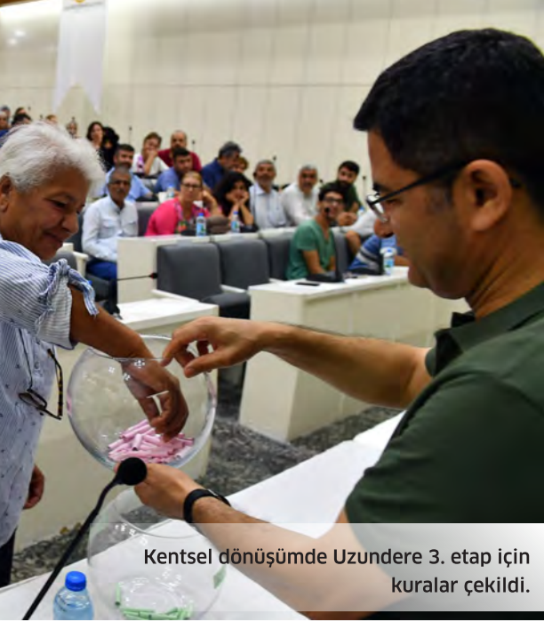
Kentsel dönüşümde Uzundere 3. etap için kurular çekildi.