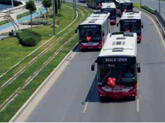
Yenilenen otobüs filosu ile daha konforlu seyahat mümkün.

Üç yılda filoya 666 milyon liralık yatırımla 473 otobüs eklendi. Feribot sayısı 7'ye çıktı. Kentte bisiklet yolu 89 kilometreye ulaştı.