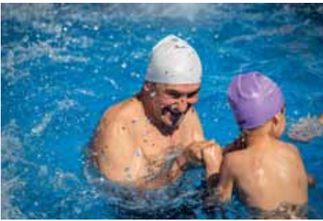
“Sporda fırsat eşitliği” ilkesi kapsamında “arka mahallelerde” üç portatif yüzme havuzu kurularak 6 bin çocuğa ulaşıldı.