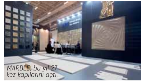
MARBLE, bu yıl 27. kez kapılarını açtı.

■ 4. UCLG Kültür Zirvesi, İzmir Büyükşehir Belediyesi ev sahipliğinde 9-11 Eylül 2021 tarihlerinde "Kültür: Geleceğimizi Kurarken" başlığı ile İzmir'de düzenlendi. Zirve sonunda yayınlanan "Kültür İnsanlığın Geleceğini Kuruyor" başlıklı İzmir Deklarasyonu ise özgün niteliği nedeniyle kültürü hak ettiği konuma yerleştirmek adına önemli bir belge olarak literatürdeki yerini aldı. ■ Dünya çapında gastronomi alanında ün yapmış 31 kentten oluşan Delice-Dünya Gurme Kentler Ağı, pandemi sonrası ilk toplantısını 23-25 Kasım 2021 tarihlerinde İzmir'de yaptı. ■ İzmir'in dünya kenti olması hedefi doğrultusunda Almanya'nın Başkenti Berlin, Bremen, Bielefeld, Frankfurt ve Hamm kentlerinde oluşturulan Almanya İzmir Tanıtım Ofisleri açıldı.