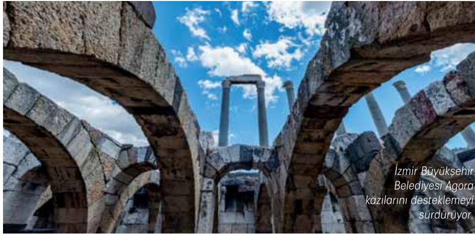
İzmir Büyükşehir Belediyesi Agora kazılarını desteklemeyi sürdürüyor.

İzmir Büyükşehir Belediye Başkanı Tunç Soyer'in yoğun çabaları sonucunda, 6 yıl aranın ardından ilk kruvaziyer gemi Nisan ayında İzmir Limanı'na geldi. Bu yıl İzmir Limanı'na 34 kruvaziyer gemi gelecek.