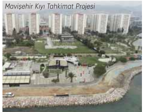
Mavişehir Kıyı Tahkimat Projesi