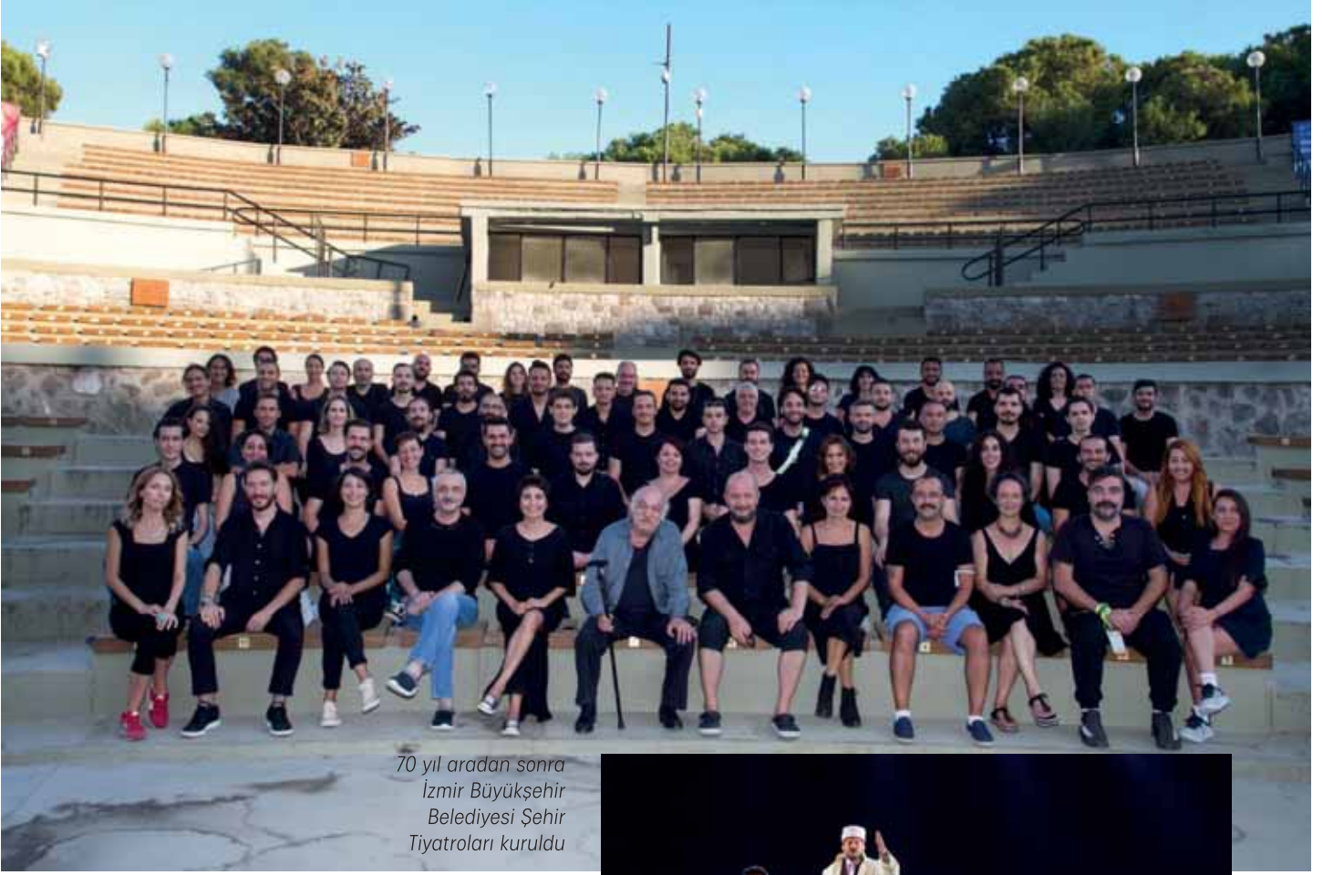
70 yıl aradan sonra İzmir Büyükşehir Belediyesi Şehir Tiyatroları kuruldu