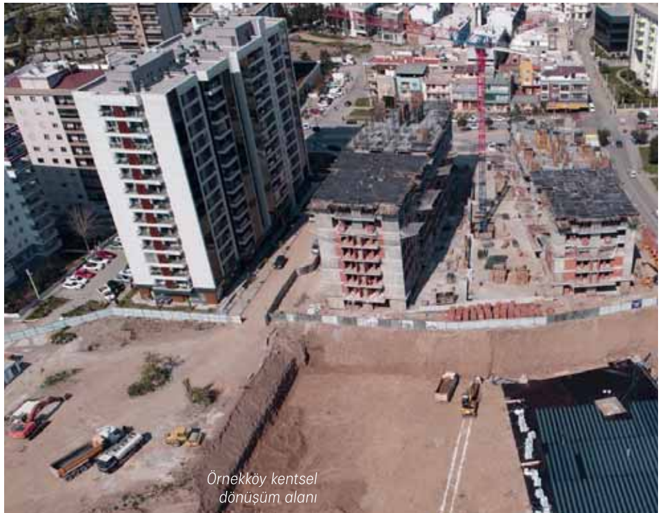
Örnekköy kentsel dönüşüm alanı

3 yılda 619 bağımsız birim hak sahiplerine teslim edildi. Uzundere, Gaziemir Emrez-Aktepe mahalleleri, Ege ve Örnekköy kentsel dönüşüm alanlarında 3 bin 958 bağımsız birimin yapımına başlandı.