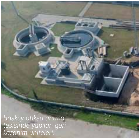
Hasköy atıksu arıtma tesisinde yapılan geri kazanım üniteleri.