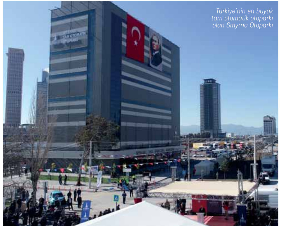
Türkiye'nin en büyük tam otomatik otoparkı olan Smyrna Otoparkı

Üçkuyular Aktarma Merkezi'nde 824 araçlık yer altı otoparkı, Karabağlar'da 160 araç kapasiteli Selvili Otoparkı, Mustafa Necati Kültür Merkezi'nde 153 araç kapasiteli yer altı otoparkı ile 636 araç kapasitesi ile Türkiye'nin en büyük tam otomatik otoparkı olan Smyrna Otoparkı hizmete girdi. 4 bin 75 araçlık açık otopark ile birlikte 6 bin araç kapasiteli kapalı ve açık otopark kente kazandırıldı.