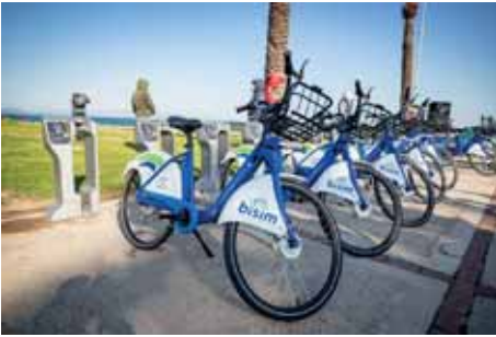
Bisiklet kenti İzmir'de son dönemde büyük atılımlar gerçekleşti.

66 Bisiklet yollarında 25 kilometrelik imalat yapıldı. 89 kilometreye ulaşan bisiklet yolları yeni düzenlemelerle 107 kilometreye çıkacak. Bisiklet istasyonlarının sayısı 60'a, bisiklet sayısı 890'a çıktı. Tandem ve çocuk bisikletleri BİSİM sistemine dahil oldu. 99