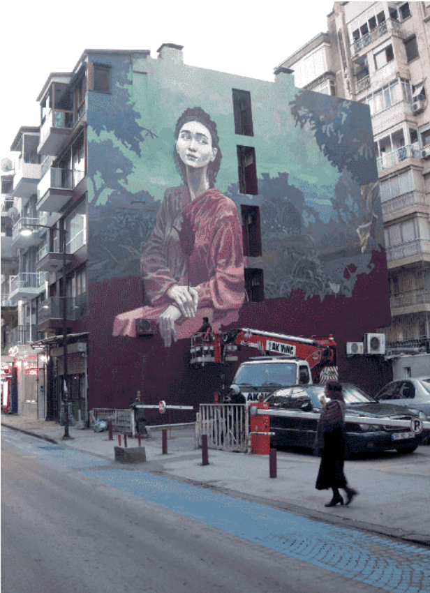
4 Sanatçının katıldığı Mural İzmir II etkinliği ile birlikte kent genelinde mural çalışmaları yaygınlaşıyor.