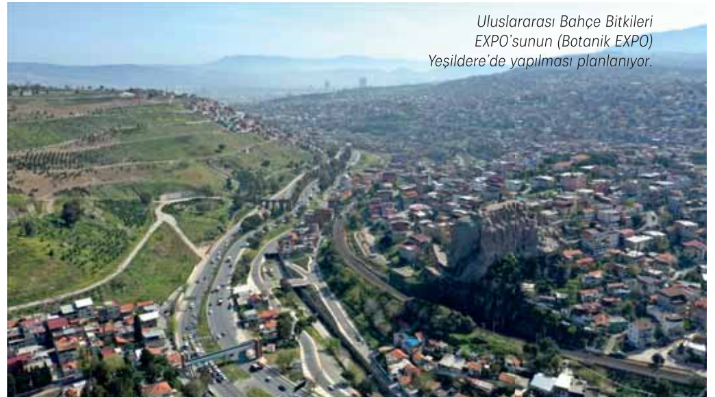
Uluslararası Bahçe Bitkileri EXPO'sunun (Botanik EXPO) Yeşildere'de yapılması planlanıyor.

■ Yeşildere'de kurulacak fuar alanı tematik sergilerin, dünya bahçelerinin, sanat, kültür, gıda ve diğer etkinliklerin yapılacağı önemli bir cazibe merkezi olacak.