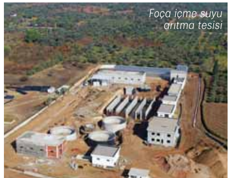
Foça içme suyu arıtma tesisi