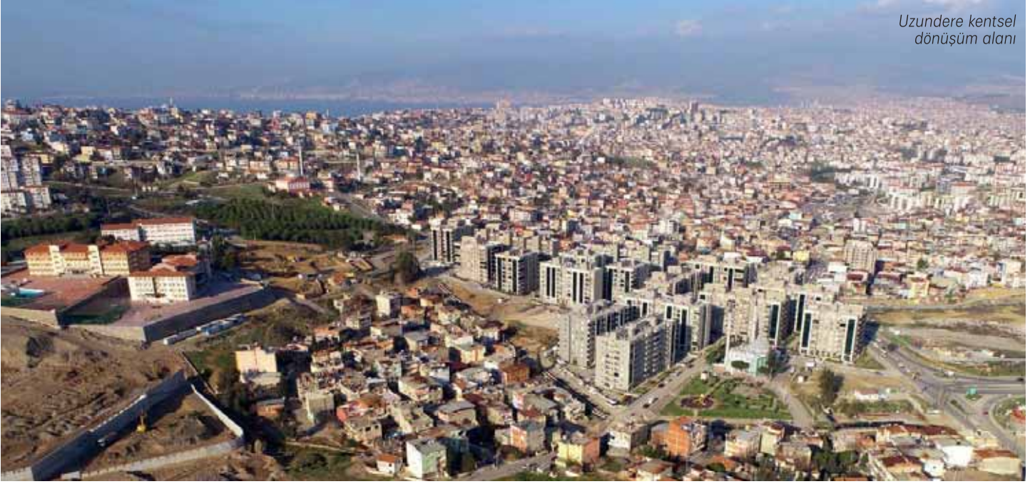
Uzundere kentsel dönüşüm alanı