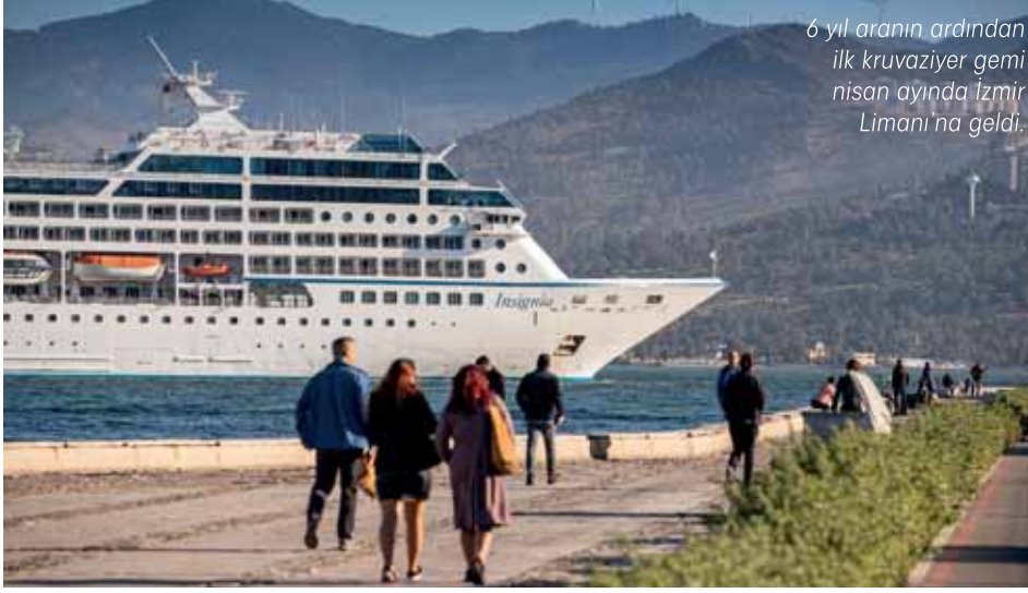
6 yıl aranın ardından ilk kruvaziyer gemi nisan ayında İzmir Limanı'na geldi.

İzmir Büyükşehir Belediye Başkanı Tunç Soyer'in yoğun çabaları sonucunda, 6 yıl aranın ardından ilk kruvaziyer gemi Nisan ayında İzmir Limanı'na geldi. Bu yıl İzmir Limanı'na 34 kruvaziyer gemi gelecek.