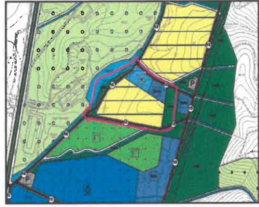
Nazım İmar Planı Değişikliği

- İzmir 5. İdare Mahkemesinin 2018/349 esasına kayden açılan davada alınan ve 262 ada 50 parselin yer aldığı bölgedeki plan kararlarını iptal eden 14.02.2019 tarih ve 2019/183 sayılı Kararın, İzmir Bölge İdare Mahkemesince alınan 26.12.2019 tarih ve 2019/1202 sayılı istinaf kararıyla bozulması sebebiyle, bölgede iptal kararı öncesi yürürlükte olan 1/5000 ölçekli plan kararlarına geri dönülerek, planda bölge Ticaret+Konut Alanı ile Gelişme Konut Alanı ve söz konusu alanlara hizmet eden teknik ve sosyal altyapı alanlarına yönelik kararlar olacak şekilde düzenlenmiştir.