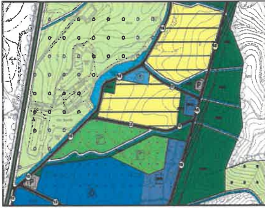
Yürürlükteki Nazım İmar Planı

- Urla İlçesi, Bademler Mahallesi, 2144, 2145, 2146 ve 2147 adalarda yer alan ve Bayındırlık İl Müdürlüğünce 11.02.2004 tarihinde onanlı 1/1000 ölçekli Mevzii İmar Planı kararlarının, gelişme konut alanı çevre yapılaşma emsalleri, halihazır durum, yerinde yaşanan uygulama sıkıntuları dikkate alınarak; Gelişme Konut Alanı, Sosyal Tesis Alanı, ilave Belediye Hizmet Alanı, Park ve Yeşil Alan olarak belirlenmek suretiyle yeniden düzenlenmiştir.