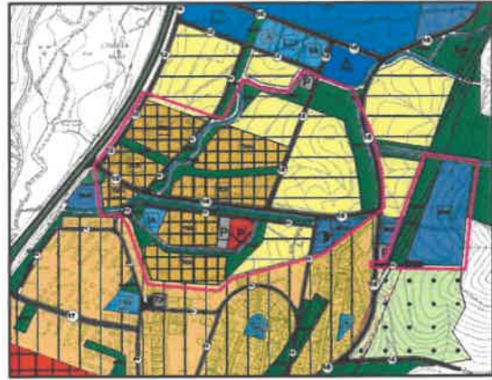
Nazım İmar Planı Değişikliği