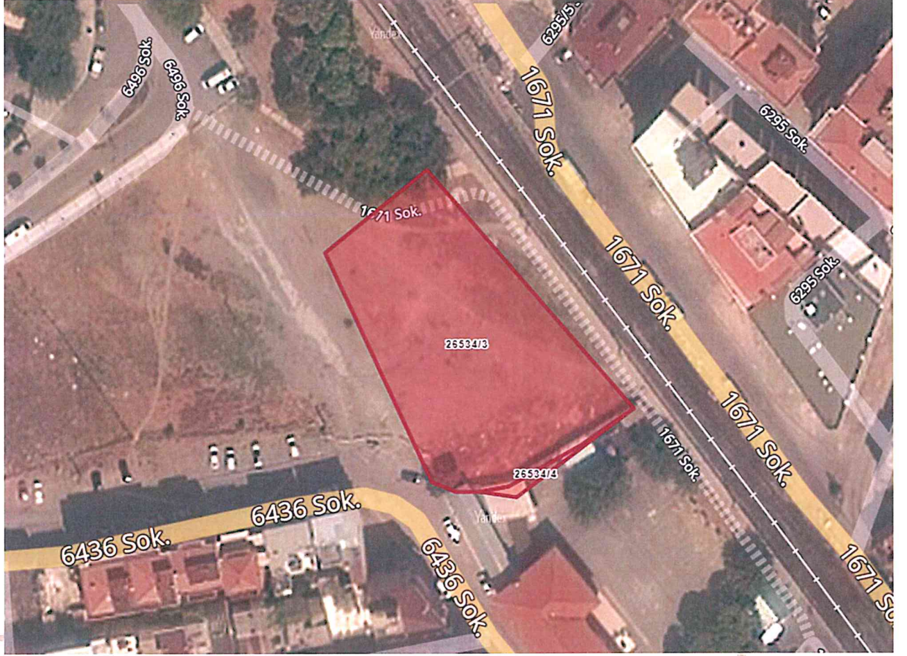
Parsele Ait Uydu Görüntüsü

Planlama Alanı; İzmir İli, Karşıyaka İlçesi, Şemikler Mahallesi sınırları içinde yer alan 26534 ada 3 numaralı parsel ile kayıtlı 2.385,56 m 2 yüzölçümündeki alanı kapsamaktadır.