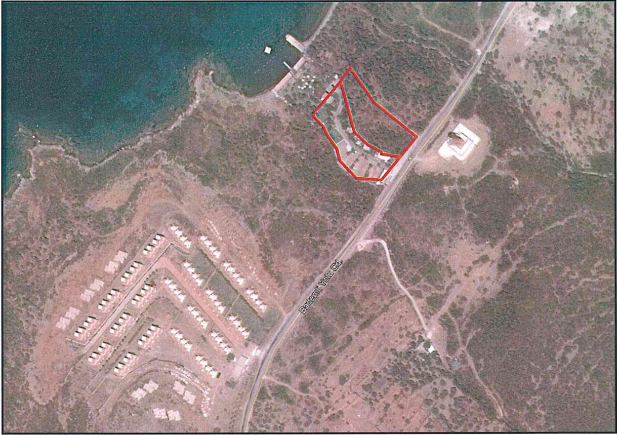
Harita 1: Planlama Alanı Yakın Çevresi

Planlama alanı Çandarlı-Dikili Karayolu güzergahı ve çevresini kapsamaktadır. (Bkz: Harita No:1, Planlama Alanı Yakın Çevresi)