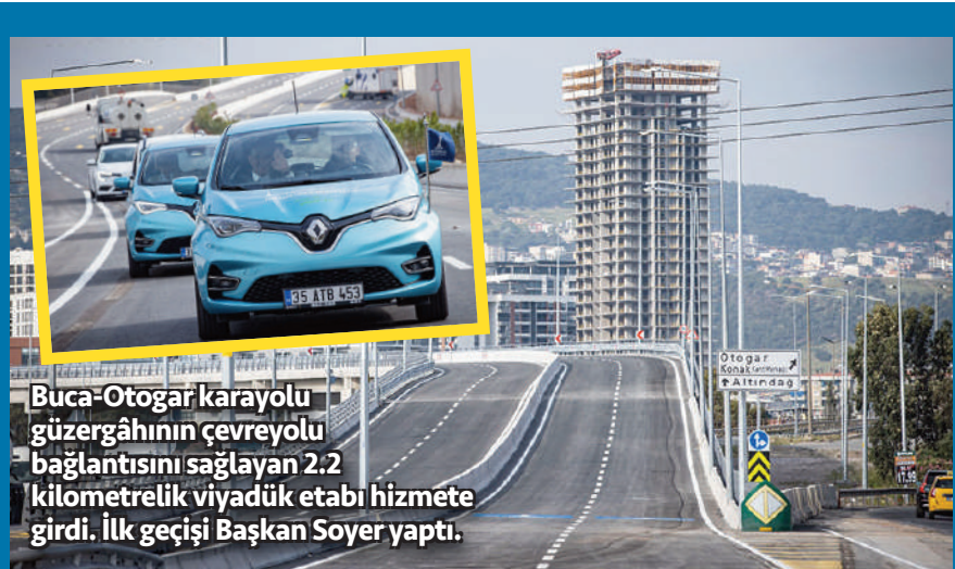
Buca-Otogar karayolu güzergâhının çevreyolu bağlantısını sağlayan 2,2 kilometrelik viyadük etabı hizmete girdi. İlk geçişi Başkan Soyer yaptı.

Olası yıkıcı depremlerde binalar hasar alsada en azından bu çalışma sayesinde can kaybı olmayacaktır" dedi.