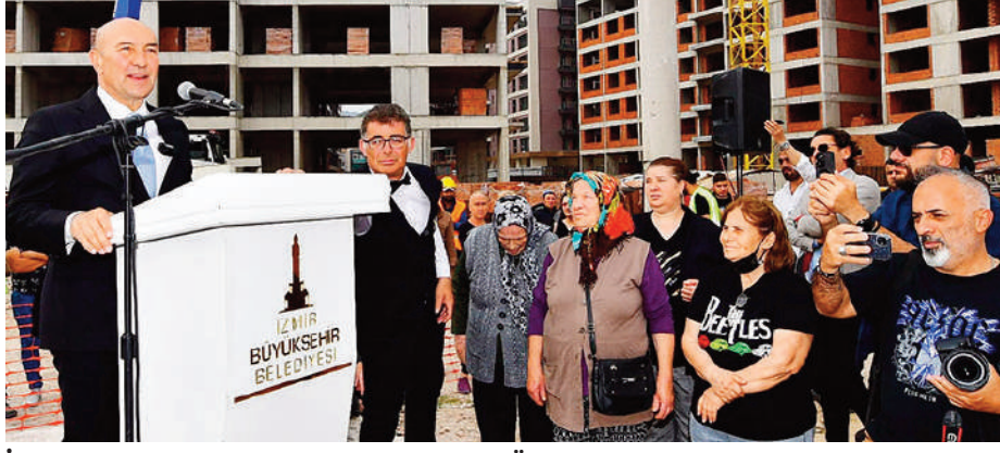
İzmir Büyükşehir Belediye Başkanı Tunç Soyer, Örnekköy Kentsel Dönüşüm projesinin 3. ve 4. etaplarındaki hak sahipleri ve kooperatif ortaklarının tanışma etkinliğine katıldı.

Büyükşehir'in, kentsel dönüşüm çalışmalarını Türkiye'ye örnek olacak bir model çerçevesinde uzlaşmayla,